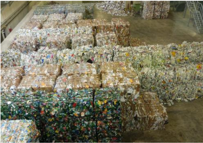
Le Centre de tri des emballages